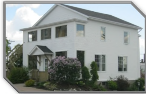
Résidence La Giboulée